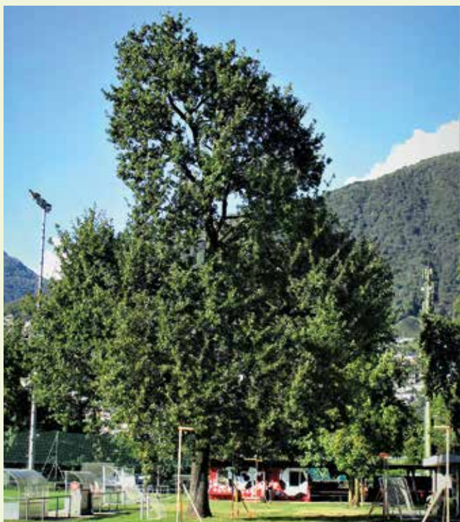
Grande quercia presso il campo da calcio, fra le più belle del Comune. Le modine a ridosso dell'albero fanno a giusta ragione temere il peggio. In presenza di un conflitto fra albero ed edificio ha finora sempre vinto l'edificio: non dovrebbe essere necessariamente così.

dell'aria, in quanto, per esempio, filtrano le pericolose polveri fini. Il clima si è riscaldato, il caldo urla e continuerà a farlo. Il problema delle estati torride si farà acuto, con ripercussioni sul benessere e la salute. Vale anche per Tenero-Contra, comune ben esposto al sole. Un solo albero giornalmente immette nell'aria sorprendenti volumi d'acqua, con corrispettivo effetto rinfrescante sui dintorni. L'ombra degli alberi sarà sempre più ricercata. L'ombra giusta nel luogo giusto, è quanto s'impone, la leggera ombra di una betulla, l'ombra fredda del frassino, quella densa di un faggio o ippocastano. E la bellezza degli alberi, il piacere che ci procurano? Con la loro infinta varietà di forme e colori, la loro individualità e potenza, gli alberi sono semplicemente belli. Al loro cospetto percepiamo tuttavia che c'è più che solo bellezza; c'è dell'altro, una realtà