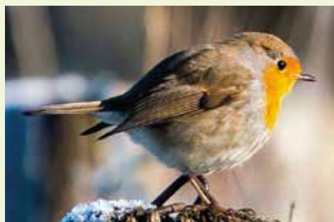
▲ Pettiroso: gli alberi sono indispensabili agli uccelli.