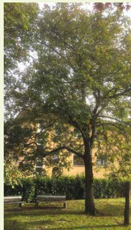
▲ Noce presso l'Oratorio Don Bosco.