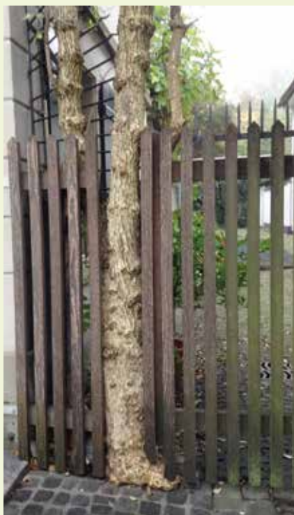
▲ Arbusto amorevolmente integrato in un cancello.