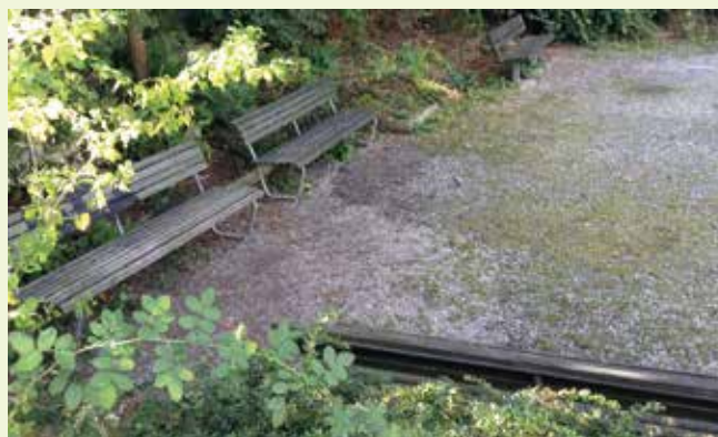
▲ Rilassante parco cittadino. Alberi e arbusti a foglia caduca danno ombra in estate e lasciano passare i raggi del sole in inverno.