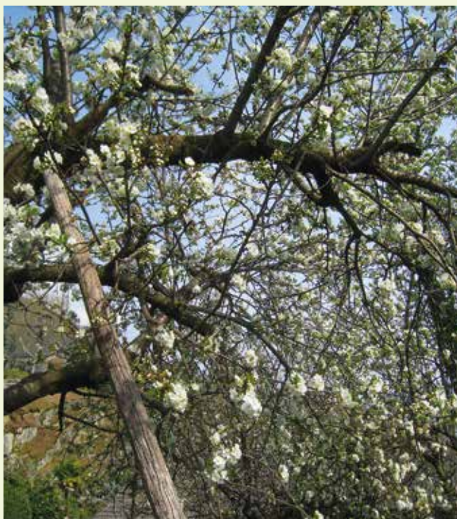
▲ Melo in fiore a Contra. Un ramo è sostenuto da un palo, segno di attaccamento all'albero. Ora non c'è più, ha dovuto lasciare posto da un edificio.

Le estati sempre più torride per via della distruzione del clima suggeriscono misure atte a migliorare gli effetti mitiganti della vegetazione. L'ombra degli alberi assume sempre più importanza, come già detto. Ci vuole un piano d'azione comunale per fronteggiare per quanto possibile il caldo estivo, sulla linea di altri comuni, con una revisione perlomeno parziale del Piano regolatore comunale. Uno dei molti esempi cui ispirarsi è quello di Sion ( www.sion.ch/acclimatasion ). Il patrimonio di alberi presente può costituire una buona base di partenza, premessa una collaborazione con i proprietari. Si hanno dunque tre settori a cui è necessario prestare molta attenzione: quello della biodiversità, quello degli effetti del clima che si deteriora e quello di tenere bello il Comune. Cosa dire in sintesi? Più alberi, più cespugli!