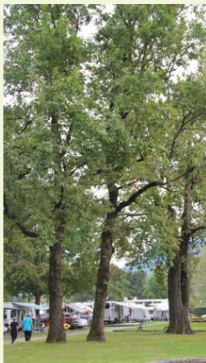
▲ Stupende querce nei campeggi. Complimenti ai proprietari che hanno saputo preservarle.